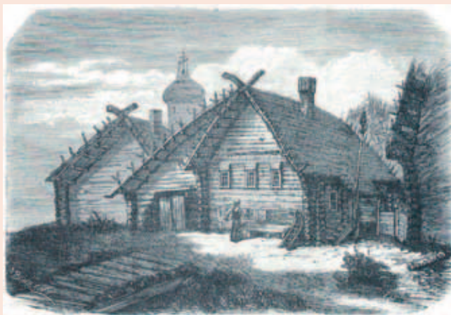
Karjalainen tupu. O. Behrens'n piirros. Julius Krook'in leikkese Suomen suks. Maantieteellisiä kuvaelmia. XIV. KUST 59, 1882.

Europas i sežo Ven'äl karjalazii on pietty omanu kanzanah ja karjalan kielder omanu kielenäh monien sadoin vuozien aijan. Suomen kanzallismieline organizatsii on 1800-luvul lähtijen sanonuh varmah vastastu läs nämih päivih suate. Ihan hyö otettih käyttöh ellendyksen Karjalan heimo. Tämä ellendys on ainos vai käytös ms. vahnais kanzalaisjärjestölöis da nimittumii merkilöi sen käyttö luobumizes ei ole nägyvis. Nuoloi järjestölöi ei ole äijän liikutannuh tazavallan prezidentan aktu vuvvel 2009 karjalan kielen vähembistöuatusas da ni Europan Nevvoston päätös hyväksyö Suomen karjalankielizet karjalazet Kanzallizien vähembistölöin suojelelu koskijan ramkuyleissobimuksen piirih. Aijat muututah, ga nuoloin järjestölöin nägökannat da käytändöt ollah ainos vie 1930-luvul. Sen verran on pietty silmäl nykyajan kehi-