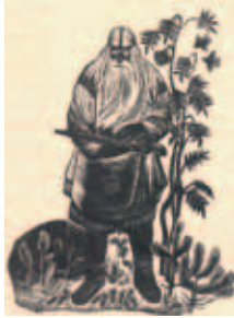
Kuva: Mjud Metshev: Väinämöinen, Pertti Lammen kokoelma

Mintah nenga? Enimis tahtuksis lienöy kyzymys karjalazien da ižoralazien väheksindäs da sit, ku kirjuttajat pietäh heidy vastoin tozidieloloi suomalazinnu. Olen puaksuh vastavunnuh moizih kirjuttajih, kudamien mieles nuoloi kanzoi da heijän omii kielii ei enämbi tarvita nygözes muailmas. Net joutah kuolta pois. Nenga olen, niilöi ei ni vouse tarviche mainita. Tämänluaduine lugihoi muanittamine da ma-